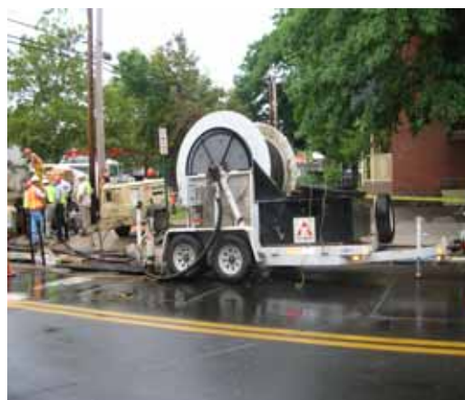
管路更生工事現場