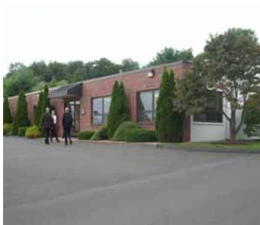
ハイトカンパ社 本社外観

管路更生市場は、世界的に今後大きな需要が見込める成長市場です。積水化学は「SPR工法」を機軸に国内 No.1 の地位を磐石なものにするとともに、「テクノロジー」「ワールドワイド」「バリューチェーン」の 3 つの成長のキーで事業領域を拡大し、グローバル No.1 を目指します。管路更生の大きな市場は、都市インフラの老朽化が本格化している欧米を中心とした先進国ですが、ハイトカンパ社買収により米国における事業基盤を獲得できました。今後は欧州への進出も検討し、『SPR』を管路更生のグローバル No.1 ブランドに進化すべく、さらなる拡大戦略を推進していきます。