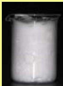
洗顔ネットクロス