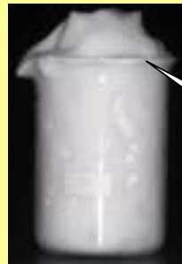
毛穴すっきり洗顔クロス

均一な「きめ細かい泡」と「超極細繊維」で毛穴に詰まった皮脂汚れや古い角質やを除去