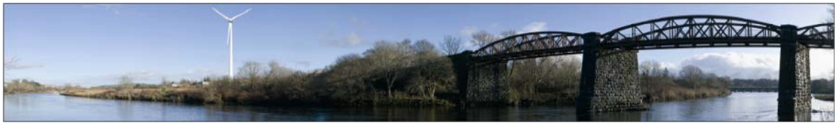
ケリー工場に設置される予定の風力発電装置のイメージ写真