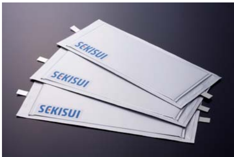
写真1. 当社のフィルム型リチウムイオン単電池

※3 セキスイハイム新商品につきましては、本日発表のプレスリリース「『スマートパワーステーション “100%Edition”』を発売」( http://www.sekisui.co.jp/news/2016/press/index.html )をご参照ください。