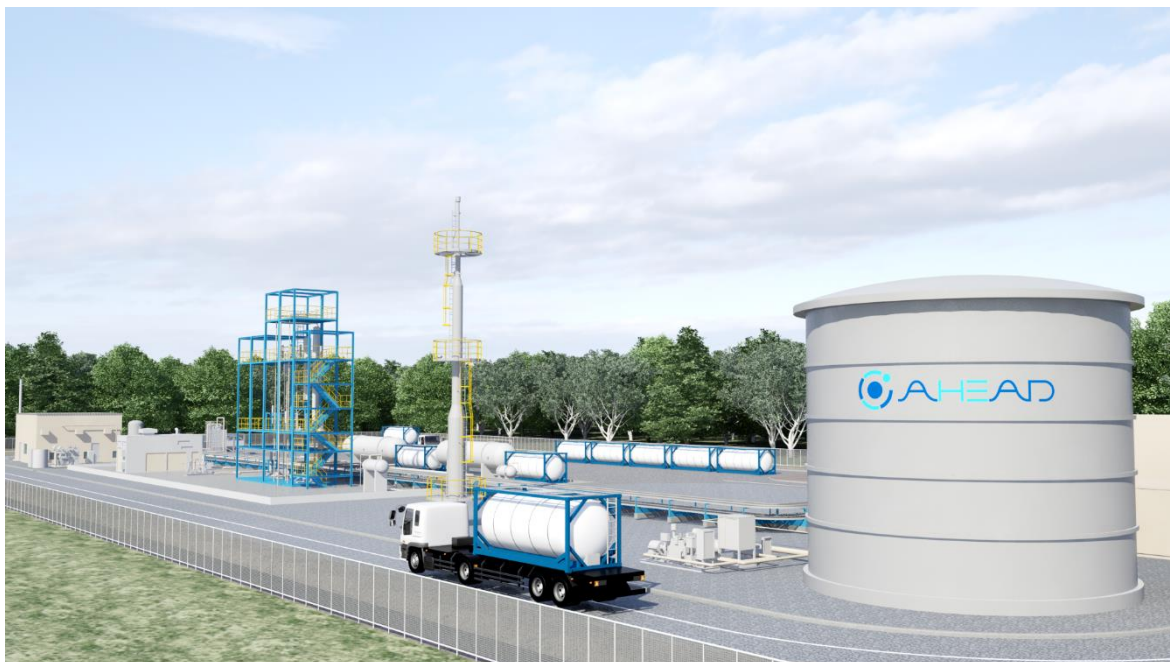
ブルネイ水素製造及び水素化プラント