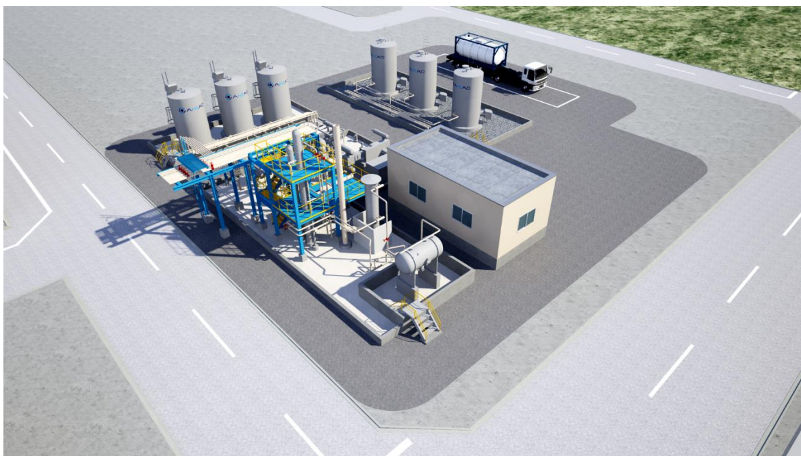
川崎脱水素プラント