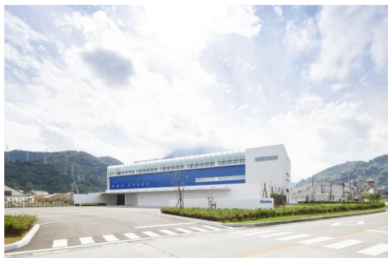
Omi Innovation Hub 外観