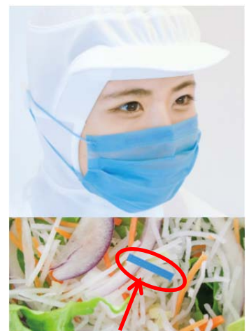
混入時の発見を容易に

マスクの上部と下部を1層、中部を2層にすることで、呼吸をしやすさと唾液の飛沫防止を両立させています。（右下図ご参照）