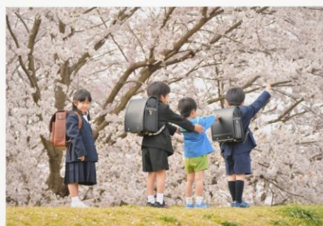
男の子 女の子 新生活がんばれー!!!