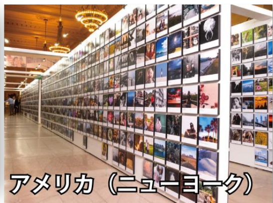
アメリカ (ニューヨーク)