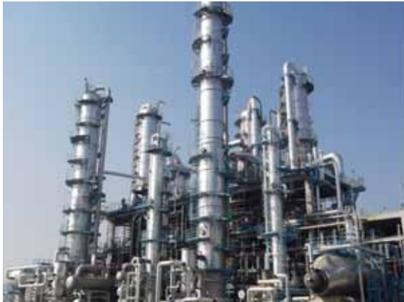
(写真：フェノール装置)

本プラントの稼働開始により、2009年1月より稼働開始しておりますビスフェノールAと併せ、原料から誘導品までの一貫競争力を持つ世界有数のフェノールチェーンが実現します。