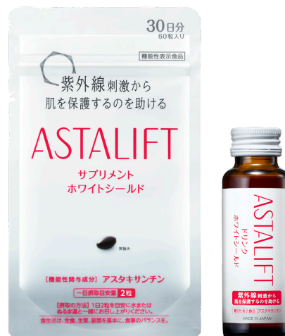
機能性表示食品「アスタリフト サプリメント ホワイトシールド」(左) 機能性表示食品「アスタリフト ドリンク ホワイトシールド」(右)

「飲む紫外線ケア」として本製品を飲用いただくことで、紫外線対策をサポートします。