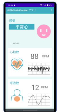
PIEZOLA ® Emotion アプリ

三井化学は、PIEZOLA ® Emotion アプリ を、ヘルスケア、化粧品、自動車、スポーツ、玩具、食品、アミューズメント、レジャー、教育、広告、マスメディア、e スポーツ等の業界に対して、アンケート（主観）だけではわからない、利用者の心理状態を読み解くツールとしてのソリューション情報サービスを提案してまいります。