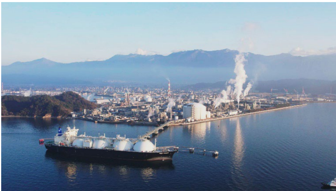
LNG タンカーと新居浜 LNG 基地、住友化学の愛媛工場

東京ガスエンジニアリングソリューションズ株式会社、四国電力株式会社、住友化学株式会社（以下「住友化学」）、住友共同電力株式会社（以下「住友共同電力」）、および四国ガス株式会社が共同出資する新居浜LNG株式会社（以下「新居浜LNG」）は住友化学愛媛工場構内（愛媛県新居浜市）において建設を進めていた、「新居浜LNG基地」の工事及び試運転を完了し、このたび同工場構内にガス供給を開始いたしました。また、近隣地区の産業向けガス供給についても本年3月の開始を予定しています。