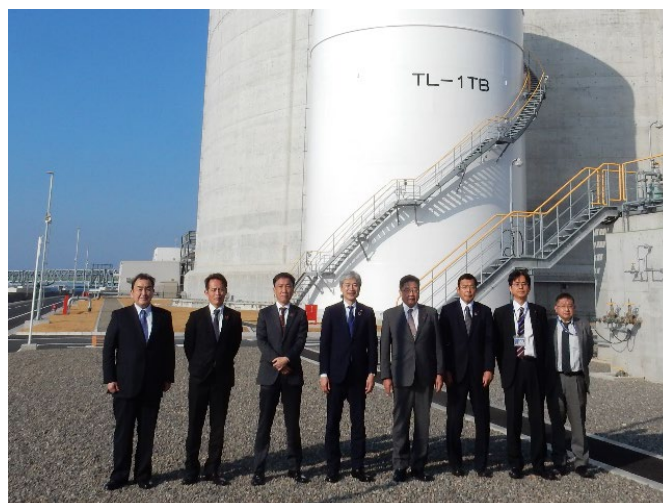
新居浜LNG及び株主各社の幹部