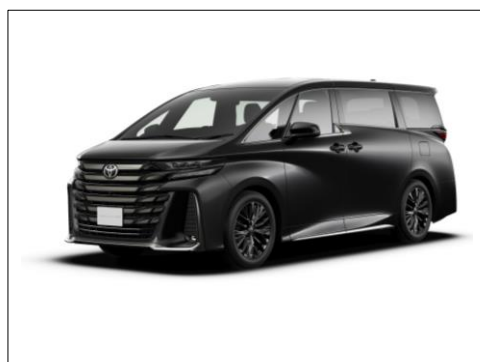
新型「ヴェルファイア」

※本画像はトヨタ自動車（株）の許諾を受け掲載しております。 本画像の他への転載、転用を一切禁止致します。