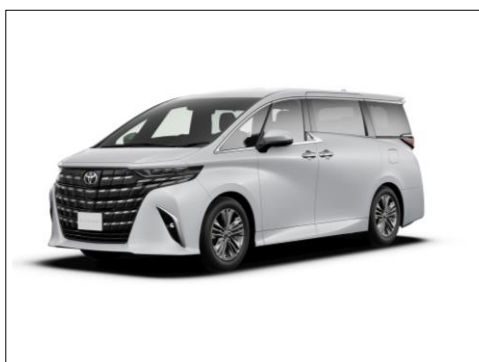
新型「アルファード」

※本画像はトヨタ自動車（株）の許諾を受け掲載しております。 本画像の他への転載、転用を一切禁止致します。