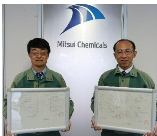
認定証と共に 左より：高妻工場長、青木安全・環境部長