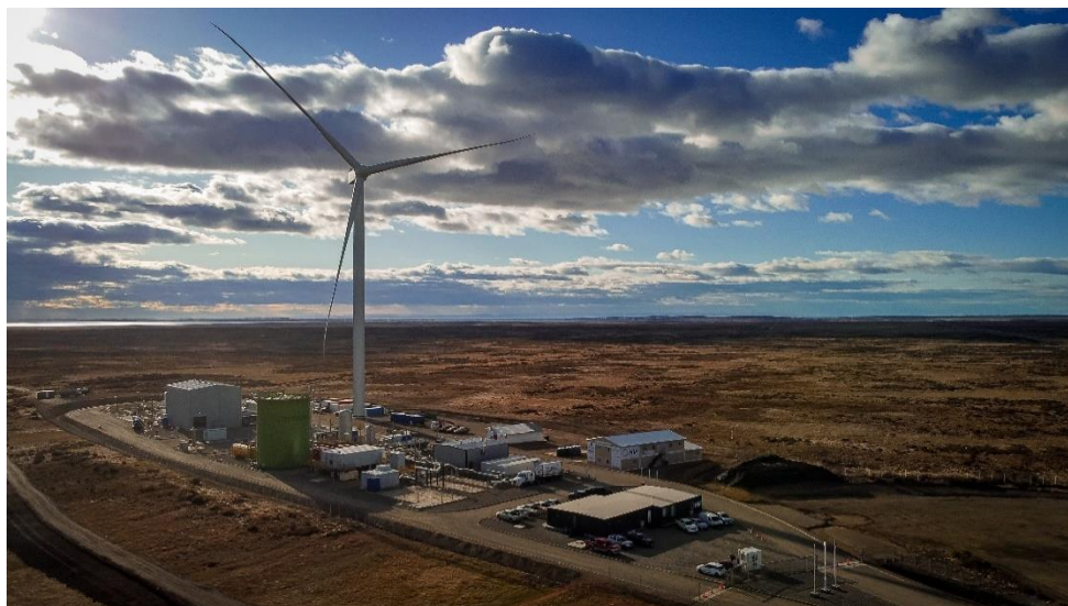
HIF 社の Haru Oni 実証プラント（チリ）