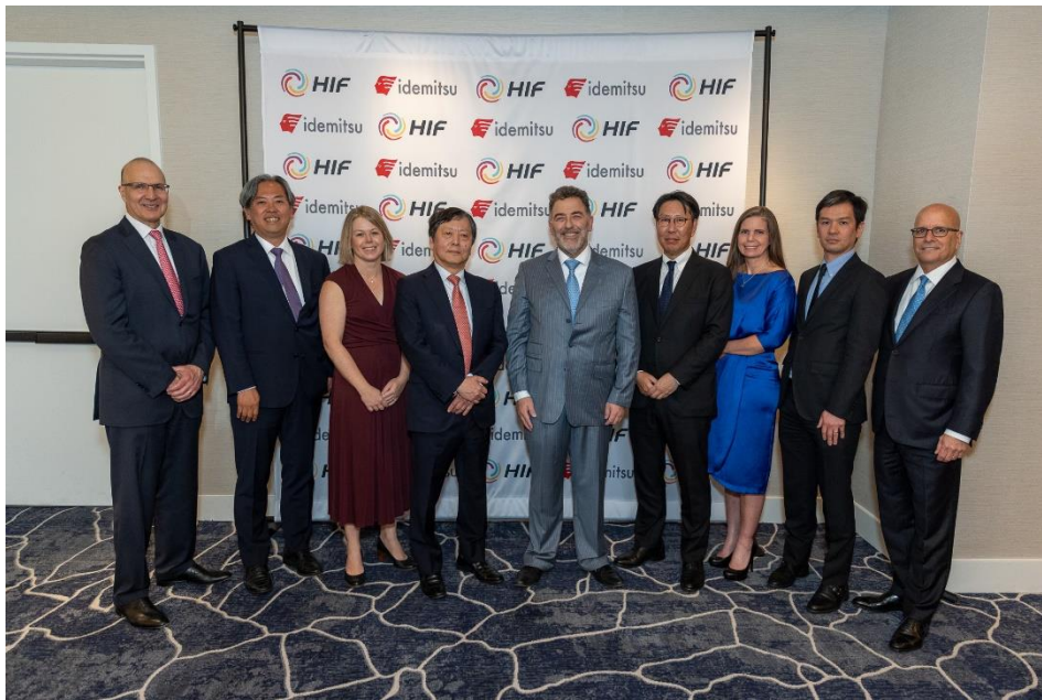
HIF 社との出資セレモニーの写真

当社は今後、当出資を通じ、合成燃料およびカーボンニュートラル燃料やその原料等として汎用性の高い e-メタノールの国内外におけるサプライチェーン構築を推進し、カーボンニュートラル社会への貢献を進めていきます。