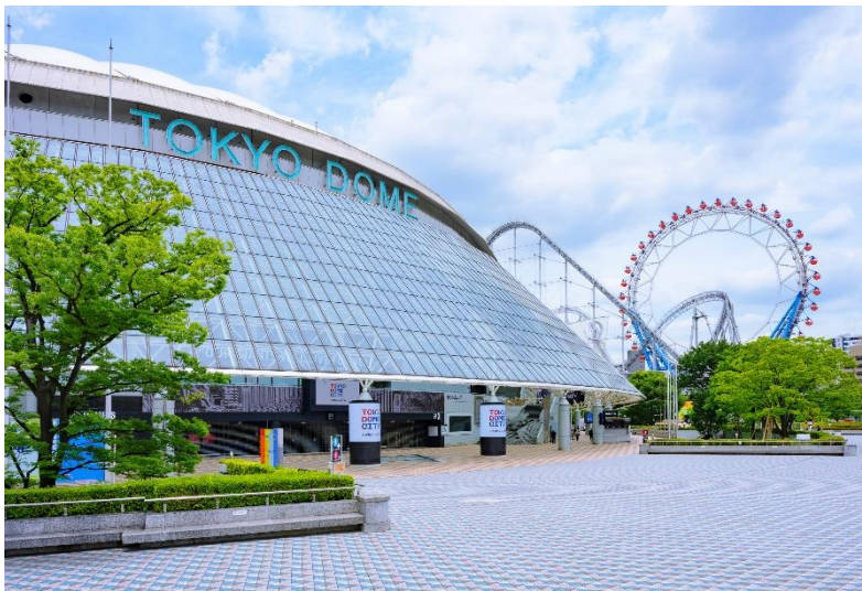
東京ドーム 正面 22 ゲート前広場

AGC（AGC株式会社、本社：東京、社長：平井良典）のガラスアンテナWAVEATTOCH ® が、株式会社NTTドコモの基地局アンテナとして、新たに日本最大規模の全天候型多目的スタジアム 東京ドーム（東京都文京区）の正面 22 ゲート前広場に設置されました。これにより広場の通信品質が改善され、混雑によるつながりにくさを緩和に寄与しています。