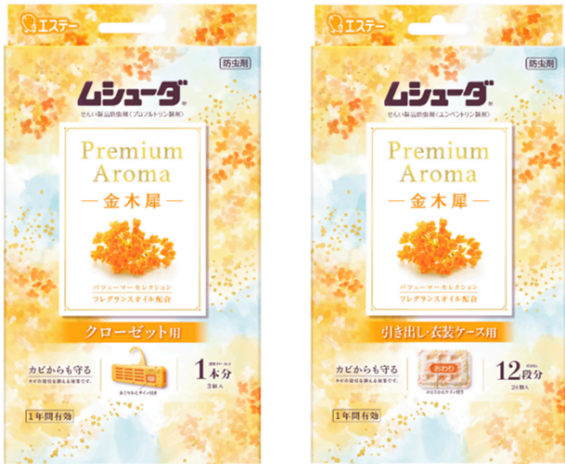
(左から)「クローゼット用」、「引き出し・衣装ケース用」