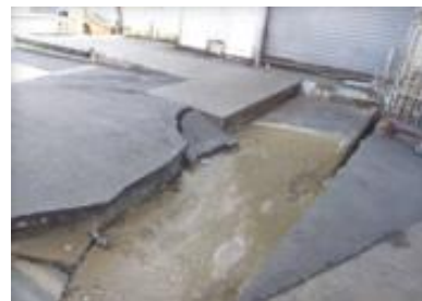
商業団地工場 地盤沈下