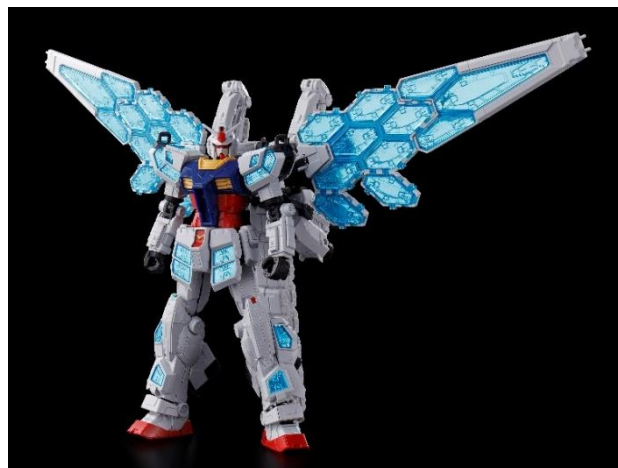
「EXPO2025 1/144 RX-78F00/E ガンダム (EX-001 グラスフェザー装備) ケミカルリサイクル Ver.」 / 3,960 円 (税 10%込) / 2025 年 4 月発売