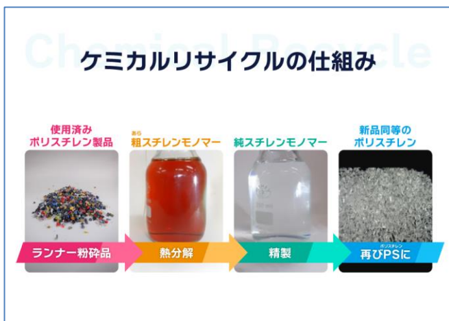
プラモデルのケミカルリサイクル イメージ

BANDAI SPIRITS と P S ジャパンは使用済ランナーを活用したプラモデルのケミカルリサイクルの研究を 2021 年から続け、この度初めてケミカルリサイクル原料を使用したプラモデル量産品の実用化に至りました。今後の本格的な活用に向けての第一歩となります。BANDAI SPIRITS と P S ジャパンは、循環型社会の実現を目指し、持続可能なものづくりの推進に積極的に取り組んでまいります。